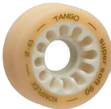
Tango super soft 90

série PROFISSIONAL, em poliuretano MDI formulado komplex