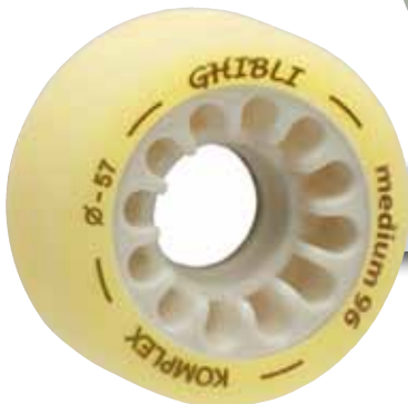
Ghibli medium 96