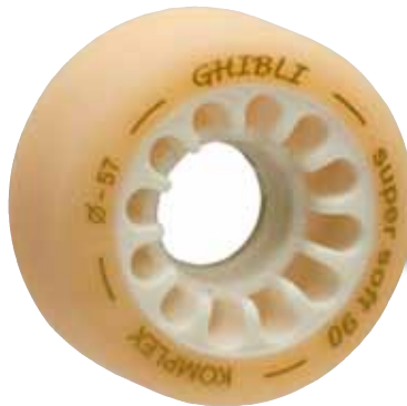
Ghibli super soft 90

série PROFISSIONAL, em poliuretano MDI formulado komplex