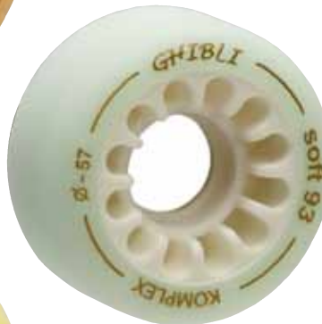
Ghibli soft 93