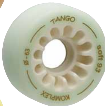
Tango soft 93