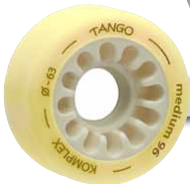
Tango medium 96